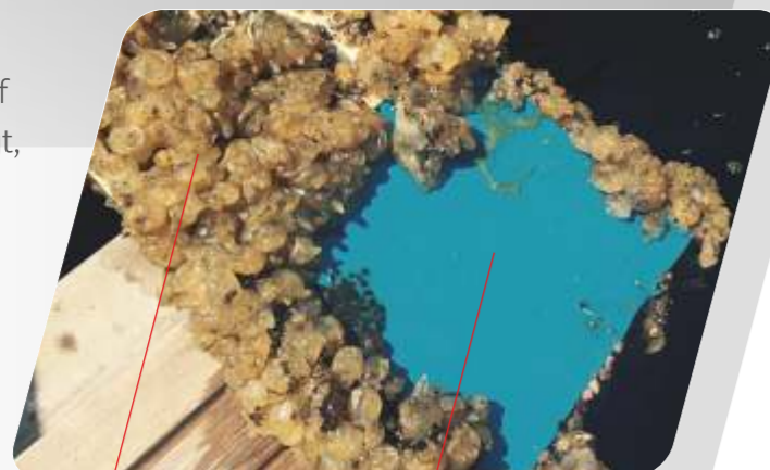
Ohne MacGlide™ Folie